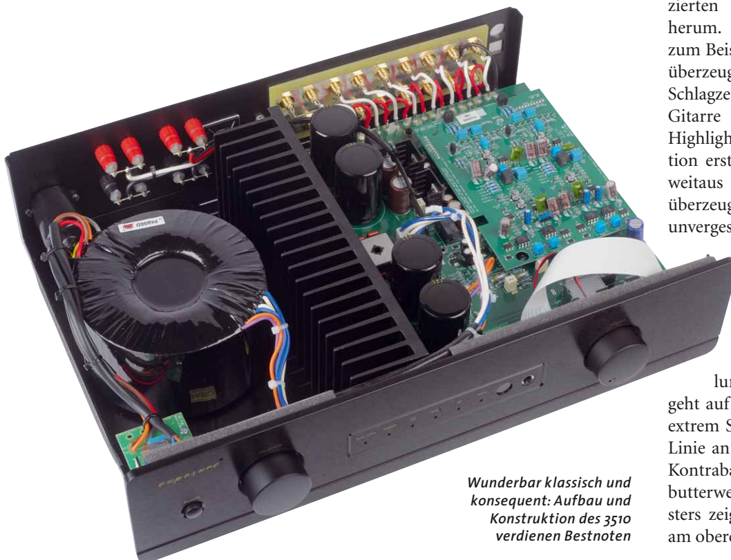
Wunderbar klassisch und konsequent: Aufbau und Konstruktion des 3510 verdienen Bestnoten

Ausdrucksstärke lautet auch hier das Zauberwort. Exposure und Epos liefern eine extrem emotionale Vorstellung, beweisen ein exzellentes Händchen für die feinen Nuancen der Einspielung, bewahren dabei aber – und das geht auf das Konto des Verstärkers – eine extrem Souveränität bei, die sich in erster Linie an der Qualität der Wiedergabe des Kontrabasses in direktem Kontrast zu dem butterweichen Klavieranschlägen des Meisters zeigt – eine fast ätherische Qualität am oberen Ende des Spektrums inklusive.