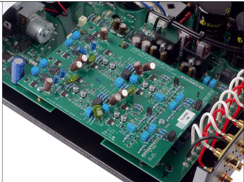
Das größtenteils diskret aufgebaute MC-Phonomodul verdient für 300 Euro eine ganz dicke Empfehlung

sogar das etwas schräge Experiment unternommen, die definitiv anspruchsvolle Wilson The Watt/Puppy an den Briten zu hängen – die kostet in etwa das Zwanzigfache des Verstärkers. Und das funktioniert weit besser als erwartet: Der beeindruckende Tieftonbereich, dessen die Wilson fähig ist, stellt sich hier sehr überzeugend mit Dampf und Ausdehnung dar. Nicht ganz mit der Kantenschärfe des D'Agostino Progression Integrated, der den Antrieb