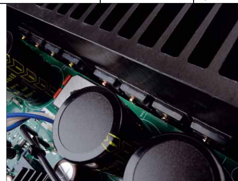
Acht bipolare Leistungshalbleiter besorgen die erheblichen Ausgangsleistungen