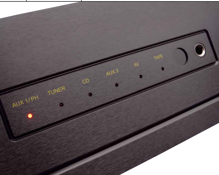
Dezente kleine rote Leuchtdioden zeigen den gewählten Eingang an. So macht man das unter Erwachsenen